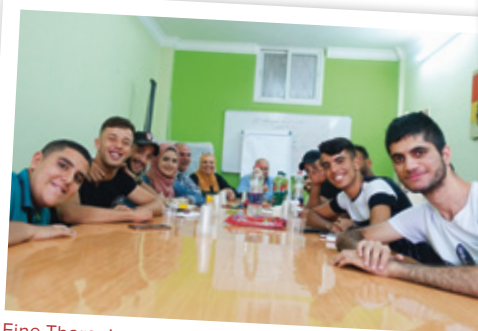
Eine Therapiestunde der anderen Art: Traumabewältigung durch Diskussionen mit anderen Betroffenen.

Über 700 Jugendliche mit psychischen und physischen Beeinträchtigungen erhalten psychosoziale Unterstützung zur Überwindung von Traumata. Sie werden in der sozialen und beruflichen Wiedereingliederung unterstützt.