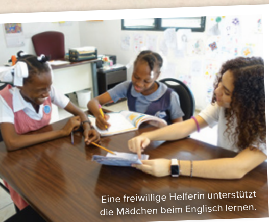
Eine freiwillige HelferIn unterstützt die Mädchen beim Englisch lernen.