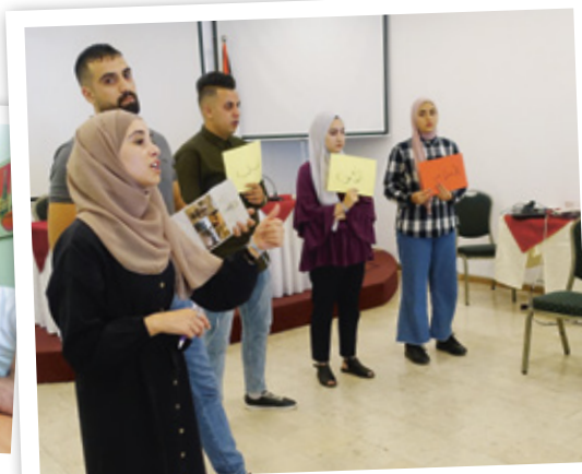
Jugendliche in Ramallah diskutieren über die Möglichkeiten politischer Mitgestaltung in Palästina.

240 palästinensische Jugendliche werden für gewaltfreie Methoden der Konfliktlösung sensibilisiert , und 200 Jugendliche aus anderen Ländern lernen die schwierige Situation in Palästina vor Ort kennen. Zudem unterstützen internationale Helfer*innen 130 palästinensische Bauernfamilien bei der Pflanzung und Ernte von Olivenbäumen, um sie vor Enteignungen zu schützen und weltweit auf die Situation der palästinensischen Bevölkerung aufmerksam zu machen.