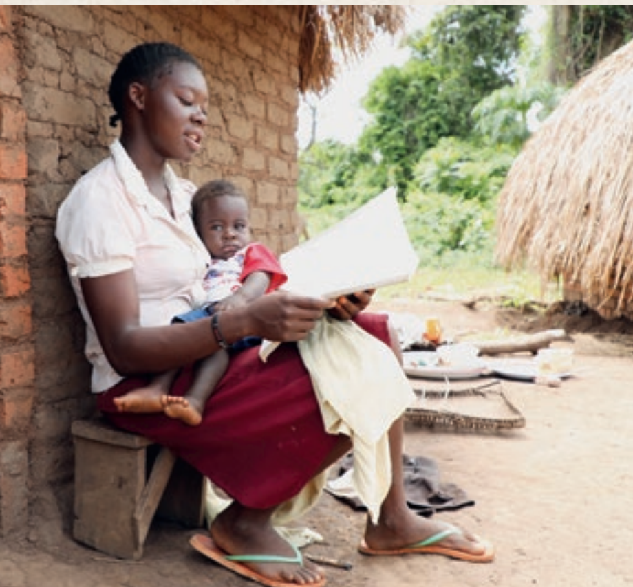
Eine junge Mutter im Südsudan vertieft zuhause ihr Wissen nach einem Workshop zum Thema Familienplanung.