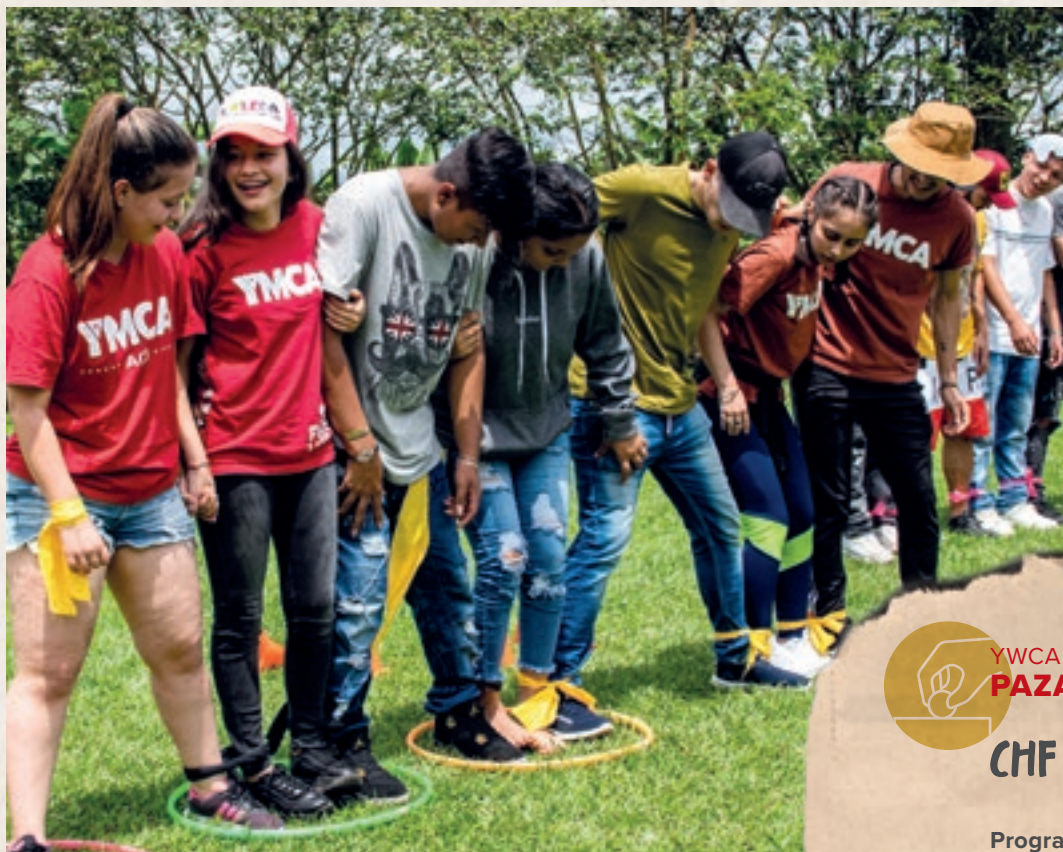
Jugendliche lernen spielerisch, was es bedeutet, im Team zu arbeiten und sich aufeinander verlassen zu können.

Jugendliche haben das ein Jahr dauernde Projekt, welches ein Basismodul sowie ein frei gewähltes Vertiefungsmodul beinhaltet, durchlaufen und abgeschlossen.