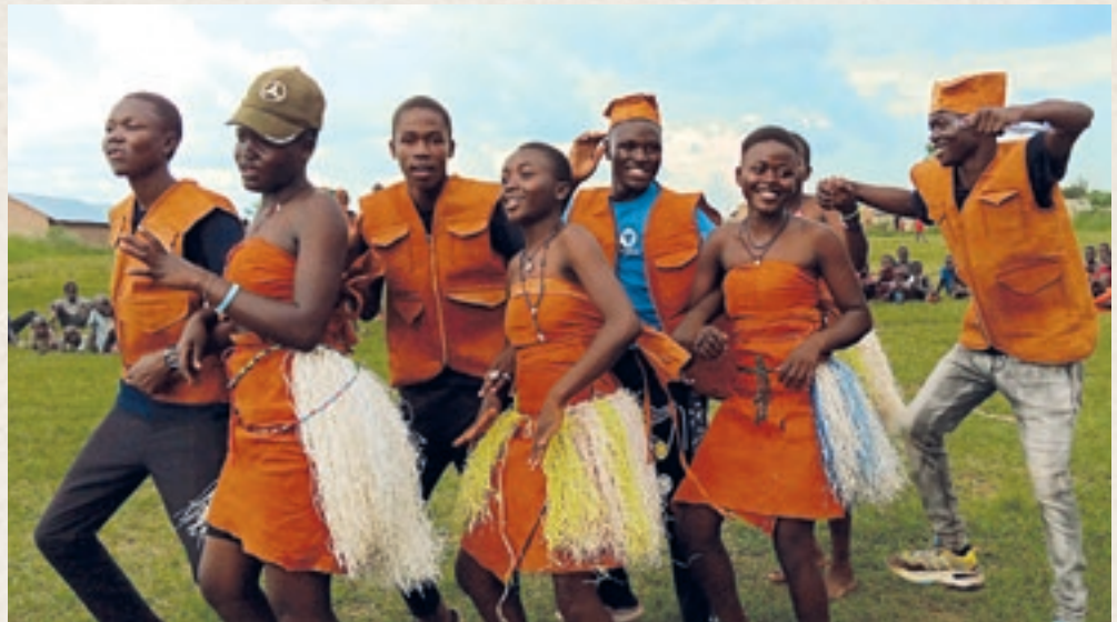
Jugendliche in der Flüchtlings-siedlung führen im Rahmen einer Kampagne für Frieden ein Theaterstück auf.

Horyzon ~ Die Schweizer Entwicklungsorganisation für Jugendliche