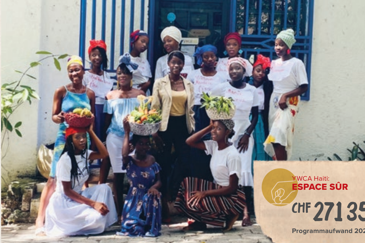
Für die jungen Frauen ist die Leadership Academy ein wichtiger und sicherer Ort, an dem sie sich untereinander austauschen und gemeinsam berufliche Ziele verfolgen können.