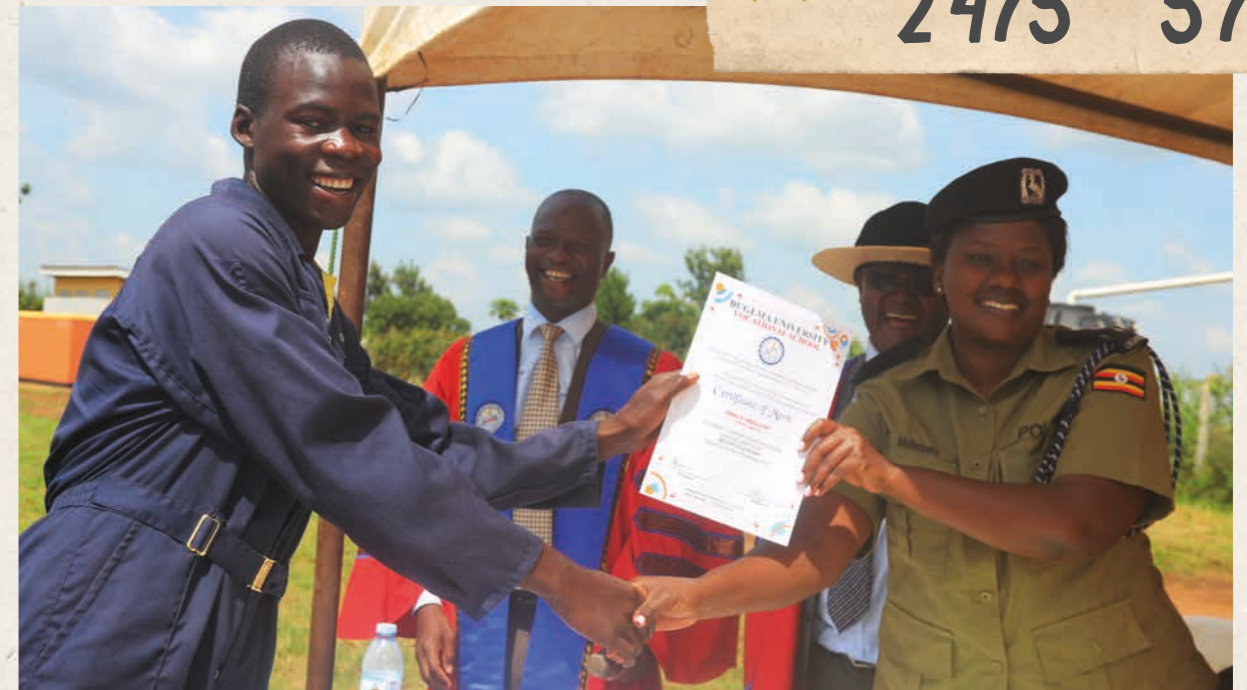
Dieser Teilnehmer freut sich über sein Diplom, nachdem er die Motorradmechaniker-Ausbildung abgeschlossen hat.

In den Flüchtlingsiedlungen Kiryandongo und Adjumani begegnen Jugendliche einem Alltag, der von Unsicherheit, knappen Ressourcen und wachsender Belastung geprägt ist. «Hope Beyond Borders» bietet ihnen geschützte Räume, psychosoziale Unterstützung und die Möglichkeit, ihre Zukunft selbstbestimmt zu gestalten. Dazu setzt Horyzon gemeinsam mit der lokalen Partnerorganisation vielfältige Aktivitäten mit den Jugendlichen um: Spargruppen und Finanzkurse, Schulungen zu Menschen- und Bürgerrechten sowie Gruppensitzungen und Maltherapien zur Traumabewältigung.