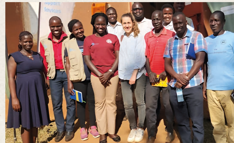
Die Horyzon-Projektverantwortliche (Mitte) bei einem Treffen mit den lokalen Mitarbeitenden in Uganda. Horyzon steht in regelmässigem Online-Kontakt mit den Partnerorganisationen und besucht die Projekte, wenn es die Sicherheitslage erlaubt, durchschnittlich rund alle eineinhalb Jahre vor Ort zu Austausch- und Evaluationszwecken.