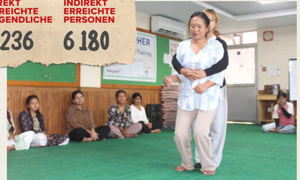
An einem durch das Projekt organisierten Selbstverteidigungskurs lernten die jungen Frauen, wie sie sich in einer Notsituation wehren können.

Im Kathmandul unterstützt «EmpowHER» junge Frauen darin, selbstbewusst für ihre Rechte einzustehen und sich aktiv für Gleichstellung einzusetzen. Viele von ihnen sind aufgrund ihrer sozialen Herkunft, wirtschaftlichen Lage oder familiären Umstände benachteiligt. Das Projekt schafft sichere Räume, in denen sie Wissen erwerben, sich austauschen und ihr Selbstvertrauen stärken können.