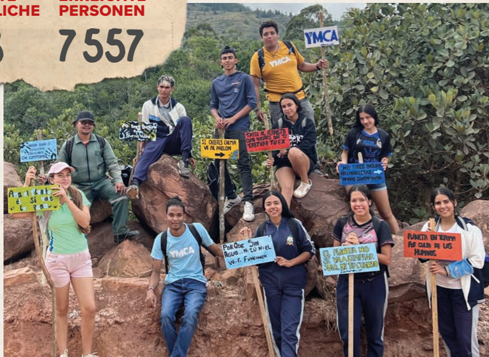
Projektteilnehmende haben im Rahmen einer Sensibilisierungskampagne in der Nähe einer natürlichen Wasserquelle selbsterstellte Schilder montiert, um Anwohnende auf den Umwelt- und Wasserschutz aufmerksam zu machen.

Viele Jugendliche in Kolumbien stehen weiterhin vor grossen Herausforderungen, was ihre Zukunftsperspektiven angeht: Begrenzte Bildungs- und Beschäftigungsmöglichkeiten, psychische Belastungen sowie die gezielte Rekrutierung durch bewaffnete Gruppierungen prägen ihren Alltag. Besonders in benachteiligten Quartieren fehlt es an unterstützenden Netzwerken. «Paza la Paz» setzt genau hier an und begleitet Jugendliche dabei, ihr Potenzial zu entfalten und einen eigenen Lebensweg zu entwickeln.