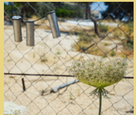
Carillon fait de cartouches de gaz lacrymogène dans un village près de Naplouse. Photo: Isabelle Aebersold, 2022

La Déclaration des droits de l'homme des Nations unies stipule que toute personne a droit à un niveau de vie lui garantissant la meilleure santé possible. Mais cela n'est malheureusement souvent pas le cas dans une région en crise comme la Palestine.